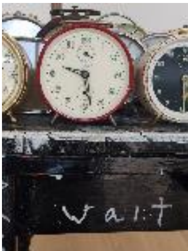
Waar zitten we in de tijd?

Ik hoop het maar ik durf er geen uitspraken over te doen.