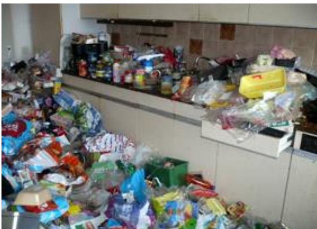
Op mijn werk tref ik wel eens anders aan hoor..

Een grote schoonmaak doe je incidenteel, maar de meesten van ons zijn toch wel continue aan het opruimen en schoonmaken in meer of mindere mate?