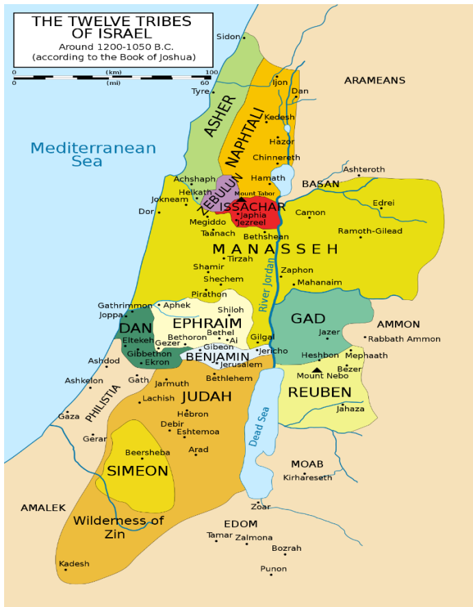
Boven: De grenzen van het land in kaart gebracht en de verdeling daarvan over de 12 stammen volgens Numeri 34 Onder: De grenzen zoals omschreven voor het Messiaanse vrederijk in Ezechiël 48