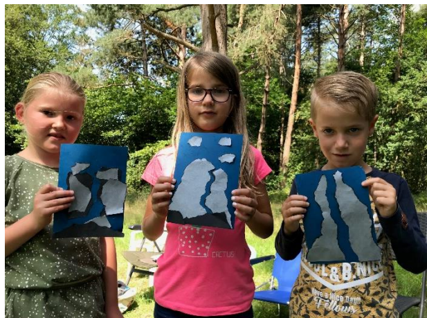
Water uit de rots

Vergelijk A met A, B met B enz. Zie je de aanvullende overeenkomsten of contrasten tussen de verschillende niveau's? Hieonder kun jij je bevindingen checken.