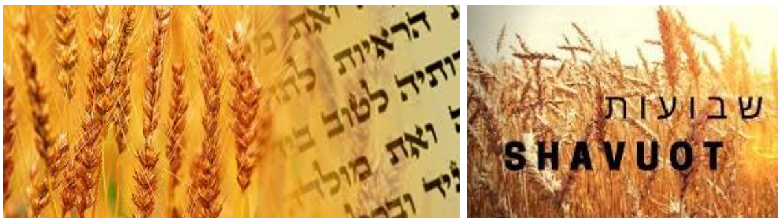
sjavoet & eertelingen van de tarwe