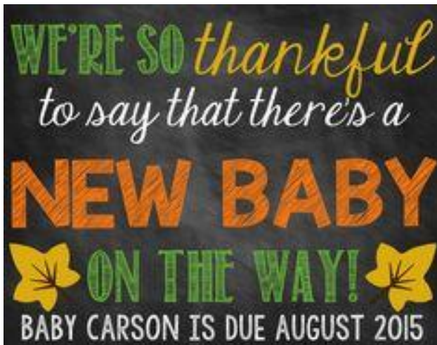
Sara zal Izaak baren...

A (v18:1) JHWH verscheen aan Abraham in Mamre, een kondigde aan dat hij een eigen zoon zou krijgen.