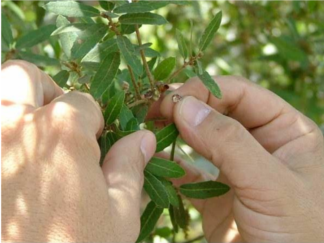
The tola'ah is carefully removed from the branch.