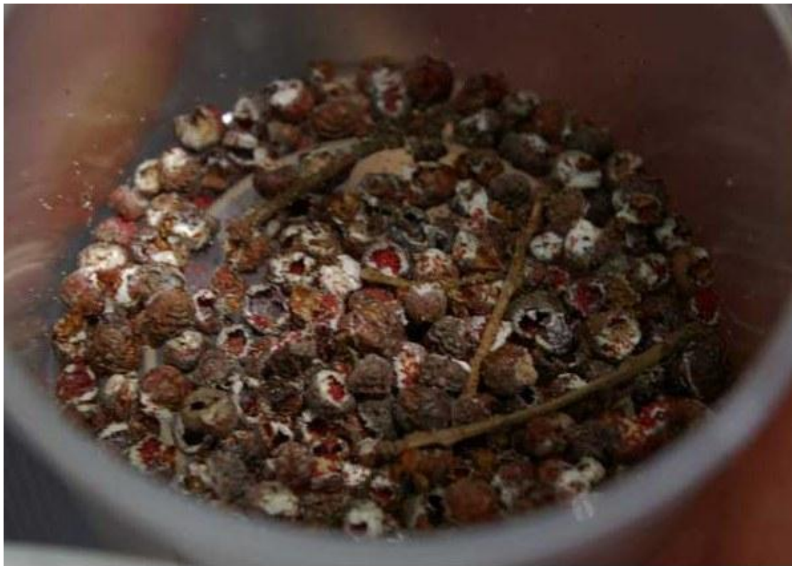
Freshly gathered tola'ot. The red "filling" are the eggs.