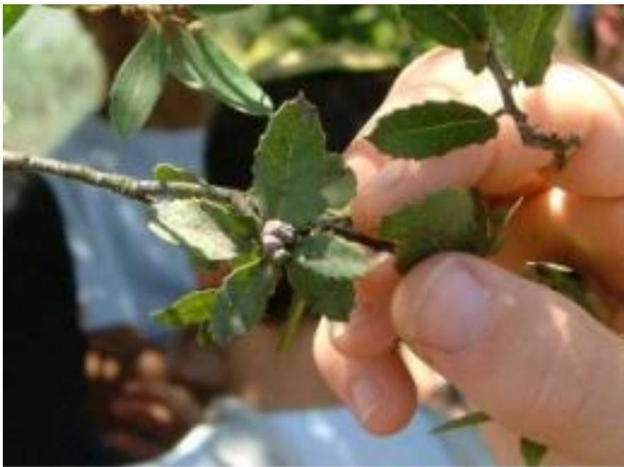
The female tola'ah attached to a branch.