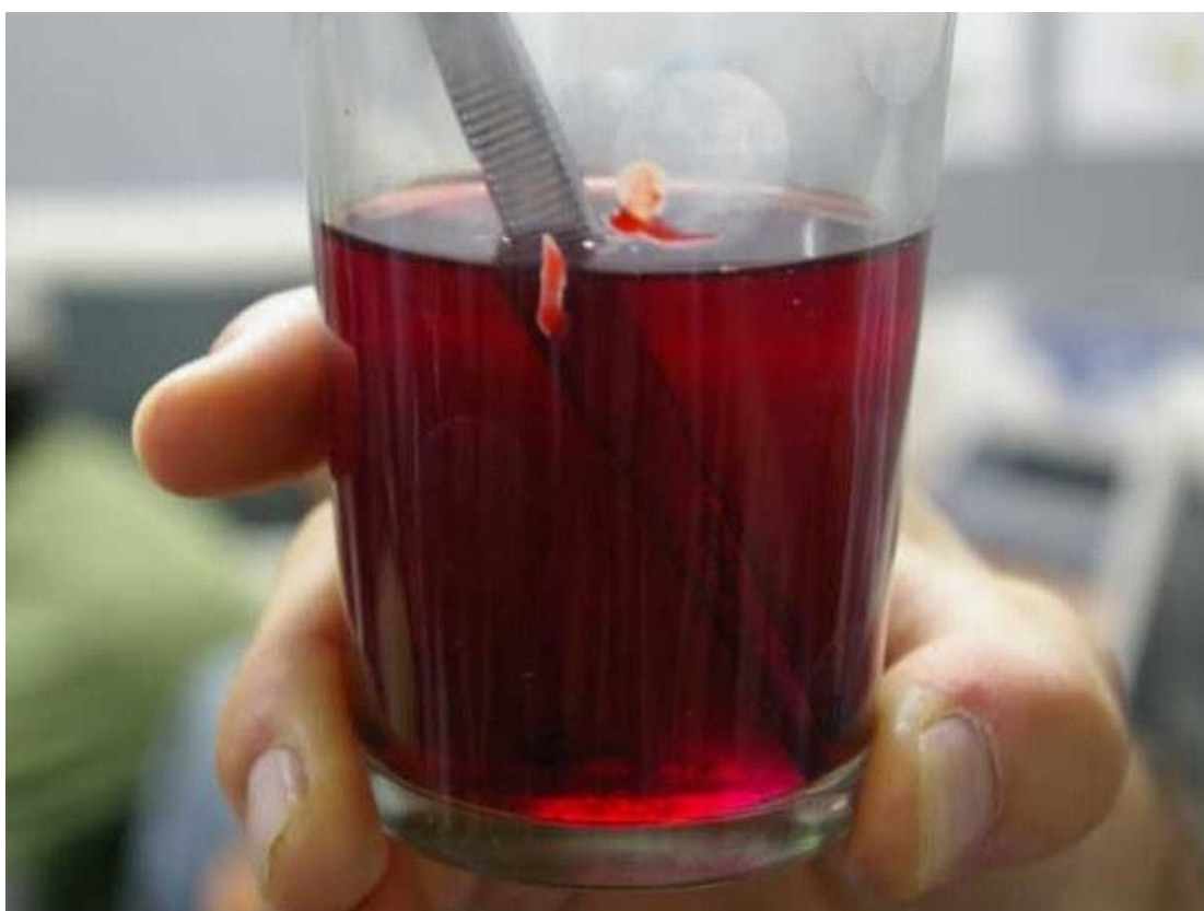
A deep crimson is attained.