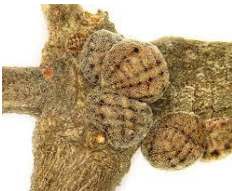
Hecht zich voorgoed vast..

Als een vrouwelijke coccus ilicis gereed is om eitjes te leggen klimt ze uit eigen beweging omhoog in een bepaalde eikenboom soort. Ze weet dat ze die tocht eenmalig gaat maken om nageslacht te verwekken en zelf zal sterven bij dat proces. Ze hecht zich vast en doet dat zo stevig dat ze nooit meer los komt.