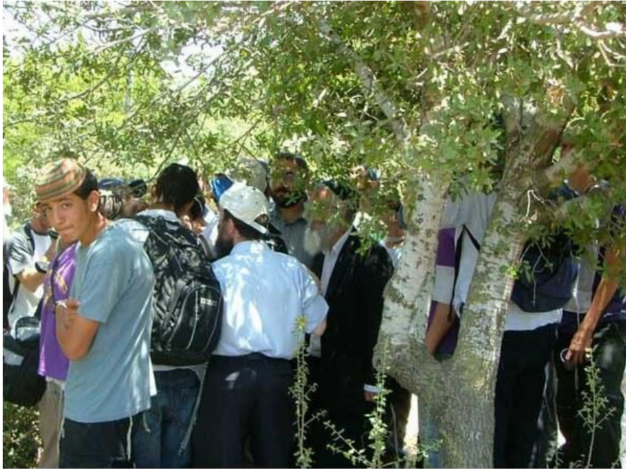
Harvesting the tola'at shani among the oaks.

Medewerkers van het tempelinstituut hebben op 16 juli 2008 voor het eerst weer de kleurstof van crimson worm geogst in eikenbomen te Neva Tsuf in de heuvels van Samaria; misschien voor het eerst sinds 2000 jaar.. bedoeld om als kleurstof te dienen niet voor voedsel, maar voor het kleuren van de priesterkleding.