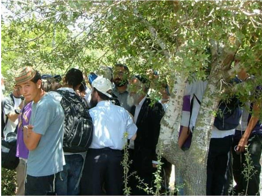
Harvesting the tola'at shani among the oaks.