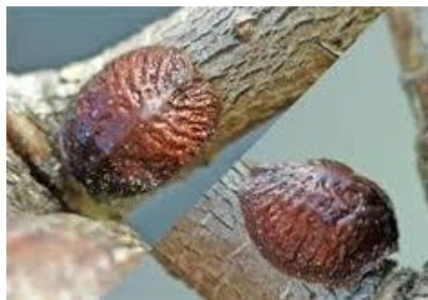
Hecht zich voorgoed vast..