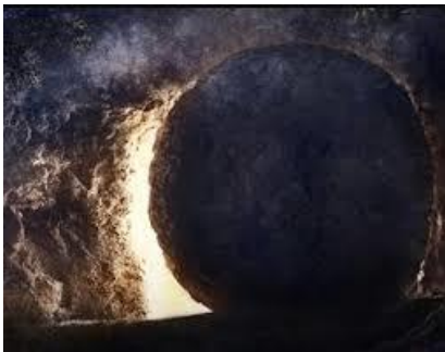
Van dood naar leven!

Als je het hele hoofdstuk herleest dan zul je zien dat het van dood naar leven gaat! Voor wie? Voor Israël Het hoofdstuk eindigt met: En Ik zal haar voor Mij in de aarde zaaien en Mij ontfermen over Lo-Ruchama. Ik zal zeggen tegen Lo-Ammi: U bent Mijn volk, en hij zal zeggen: Mijn God!