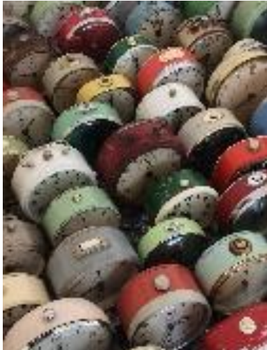
5 voor 12 of 1 voor 12?

Open staan voor de realiteit van de eindtijd; het is wat dat betreft geen 5 voor 12 maar mogelijk 1 voor 12?!