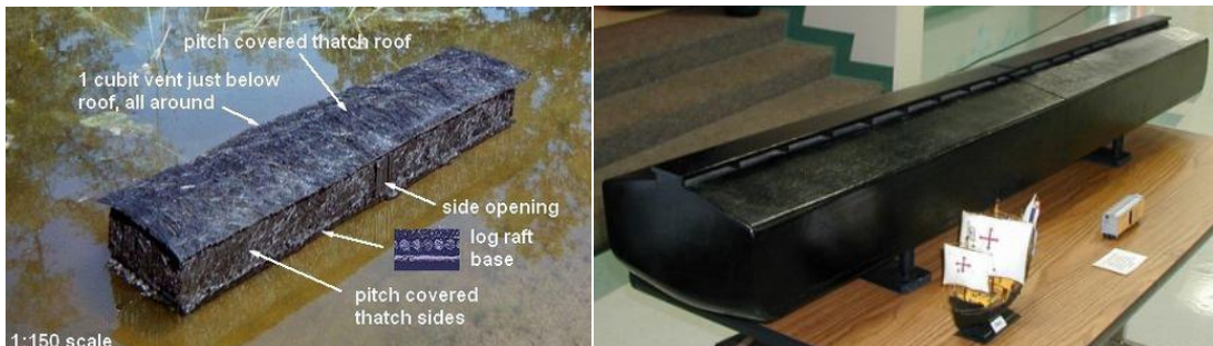
Juiste afbeeldingen van de Ark: zwart door de pek!

Een ander woordverband is het woord kaphar = H3722 = bedekken, reinigen, zuiveren, goedmaken, en ook 'met pek bestrijken' > dat doet aan de ark denken bij de zondvloed die met pek moest worden bestreken door Noach! Genesis 6:14 Maak voor uzelf een ark van goferhout. In vakken ingedeeld moet u deze ark maken en hem van binnen en van buiten met pek bestrijken.