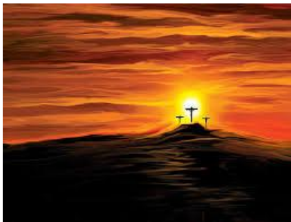
en "geestelijke" uittocht